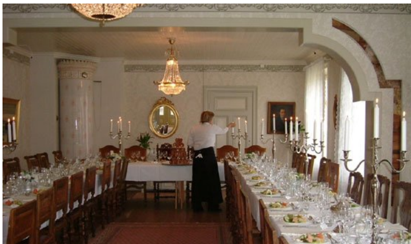
Högtidsmiddagar – sammankomster Plats för 60 personer

Övernattningar - i våra nyrenoverade rum med bibehållen atmosfär Alla priser per person/All prices per person