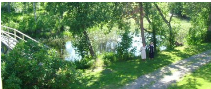
Guidad visning av herrgården 70 SEK/pers. Samling utanför entrén.